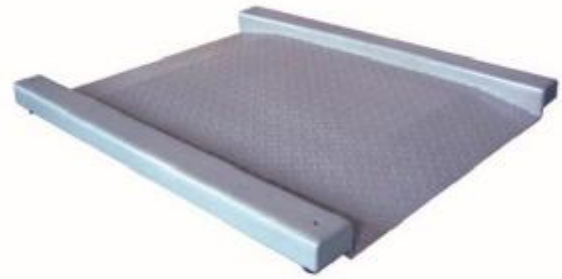
4D-LM (низкопрофильное моноблочное)