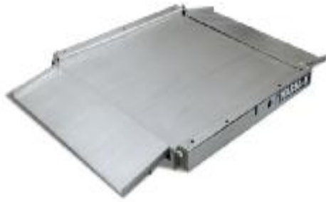
4D-LA (низкопрофильное складывающееся)