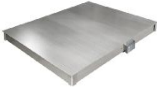
4D-P (платформенное составное)