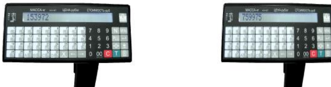
Рисунок 2 – Индикация кода юстировки

К» при подключении его к модулю 4D и вводе специальных команд описанных в руководстве по эксплуатации на терминал.