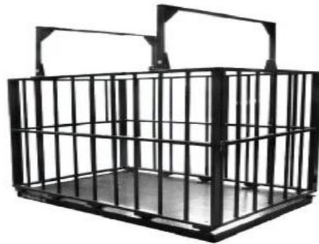
4D-L (для взвешивания скота)